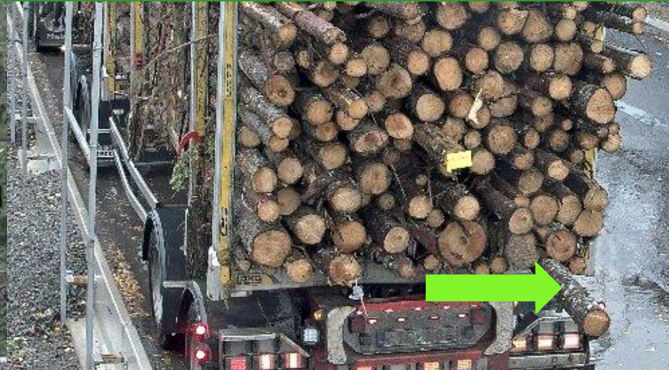
Dimensionsfel (exkl. övergrovt)

För prima gran- och barrmassaved tillåts totalt 10 %, för lövmassaved 20 %.