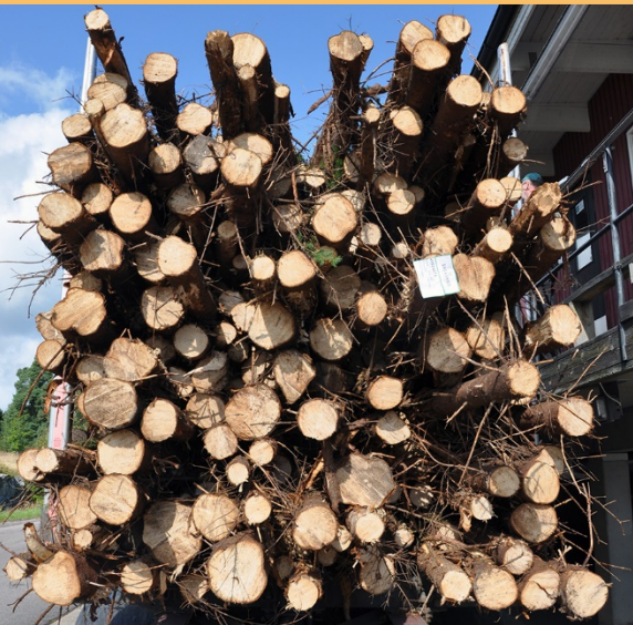
För dålig kvistning