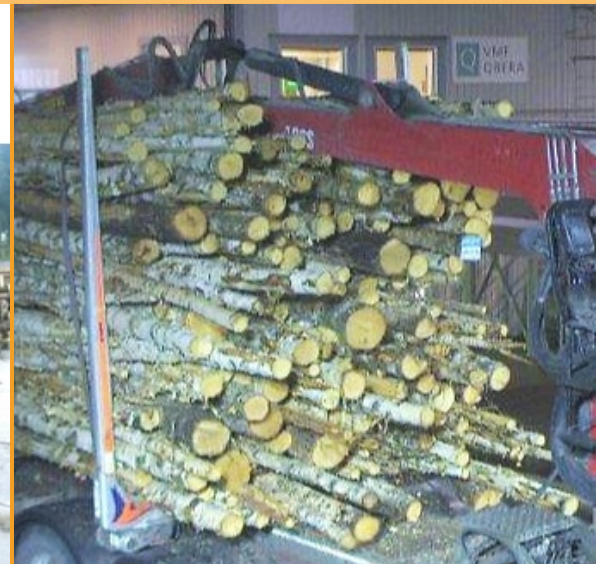
För stor andel underdimension (60 stockar i traven)