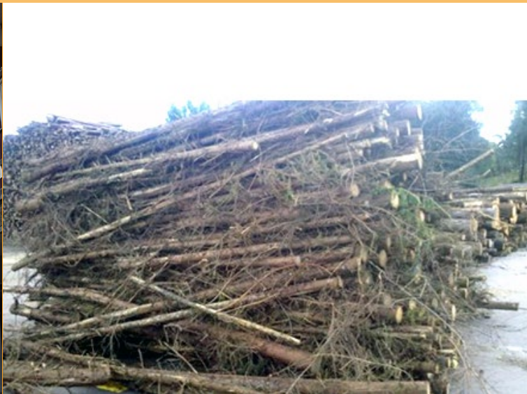
För dålig kvistning